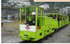
▲トロッコ電車(片道300m乗車)