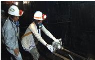
▲穿孔(せんこう)機械操作体験