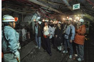
▲トロッコ下車後は元炭鉱マンがご案内