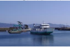
▲池島港とフェリー「かしま」