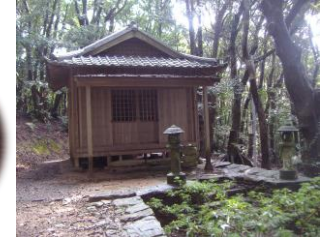
▲桔松神社(キリンタン神社)