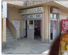
▲池島炭鉱さくら倶楽部 (当時の写真展示 コーナーなども)