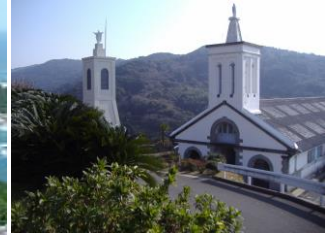
▲出津文化村「出津(しつ)教会」 明治15年・口神父の設計施行で建てられた教会 で周辺には、口神父記念館や歴史民俗資料館 などもあります。 (注)ミサなどにより教会内に立入できない場合も ございます。