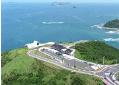
▲外海の風景(駅の駅「夕陽が丘」とめと角力灘)