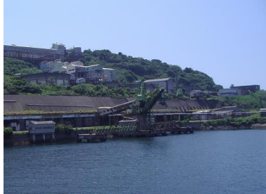
▲池島港より 石炭積み込み機など